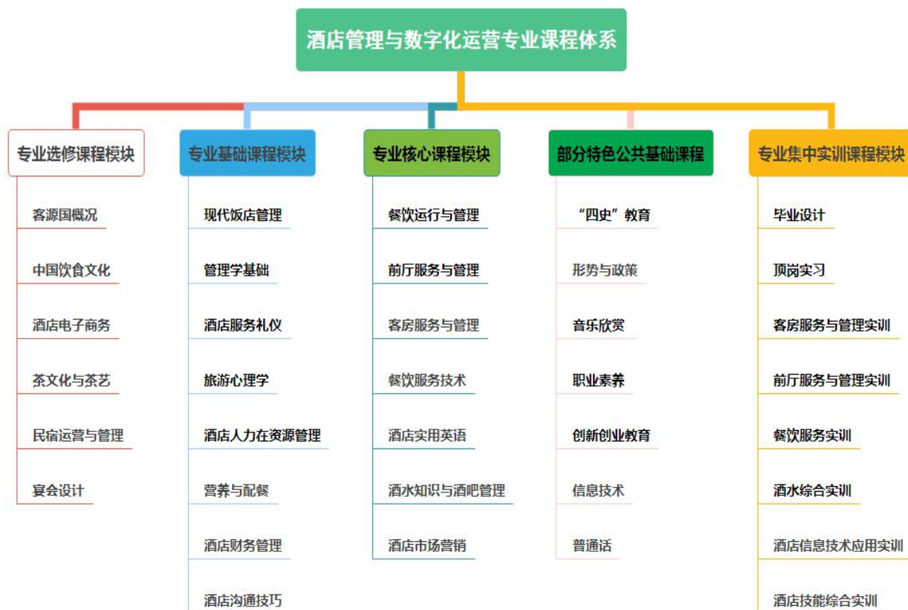
图 4 专业课程体系

本专业课程分为五大模块：公共基础课程模块（必修、选修）、专业基础课程模块、专业核心课程模块、专业选修课程模块、专业集中实训模块，共 46 门课，3184 学时，182 学分。专业课程对接国家酒店管理与数字化运营行业标准，融入相关技术等级证书内容。持续深化“三全育人”综合改革，把立德树人融入思想道德教育、文化知识教育、技术技能培养、社会实践教育各环节，推动课程思想政治工作体系贯穿教学体系、教材体系、管理体系，切实提升思想政治工作质量。结合高星级酒店业前厅、客房、餐饮、大堂吧、酒吧一线服务员和管理者职业道德与素养，融入课程思政元素，贯穿于专业课程教学全过程，具体课程结构如图 4 所示。