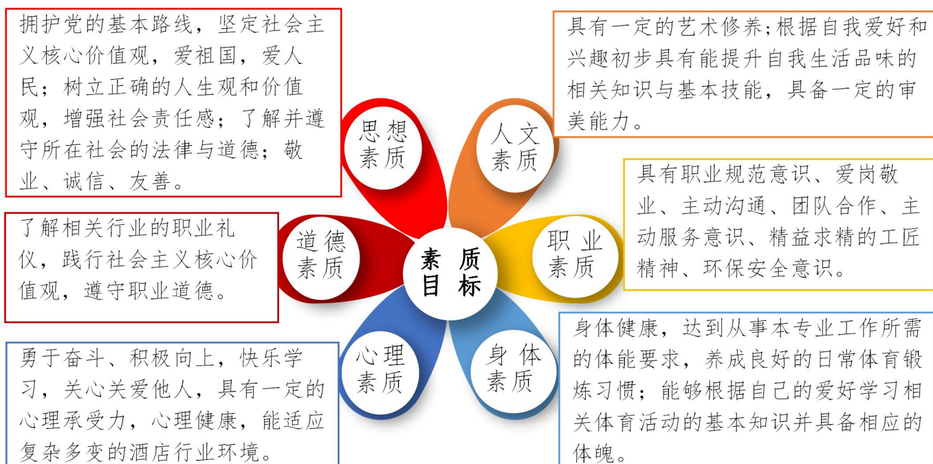
图1 素质目标示意图